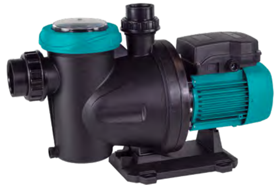
Tabla de características